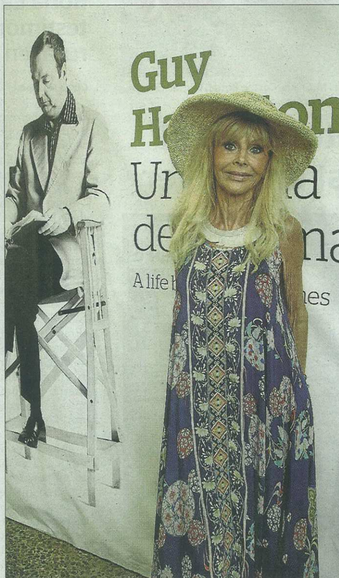
La actriz Britt Ekland, ayer, en el patio del Casal Solleric de Palma, posando para esta entrevista.